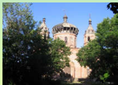
Храм Воскресения Христа Спасителя в с. Старая Ольшанка