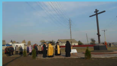
Установление Поклонного креста на месте Троицкой церкви